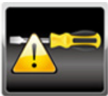
Chassis Intrusion Alert