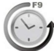
One Key Restore

Menyediakan peringatan keamanan khusus di saat Anda boot komputer dan terdapat kejadian akses tanpa sepengetahuan Anda sebelumnya. Hal ini untuk menjamin keamanan komponen dan data yang ada.